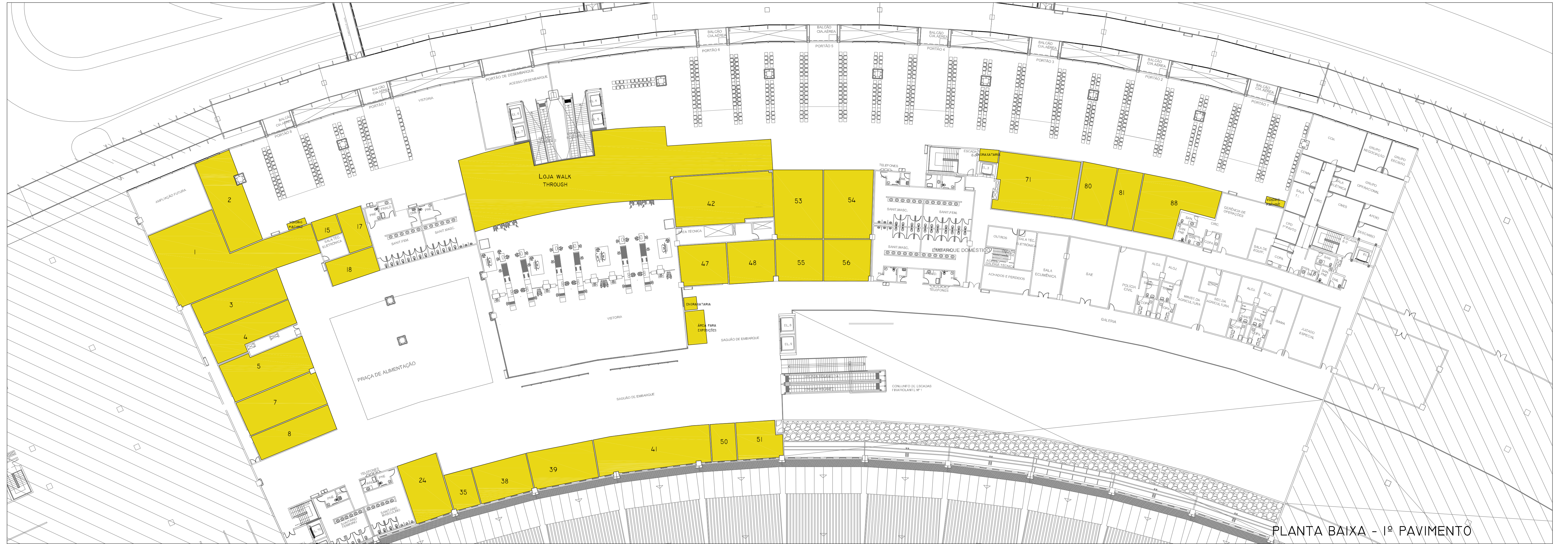
PLANTA BAIXA - 1º PAVIMENTO